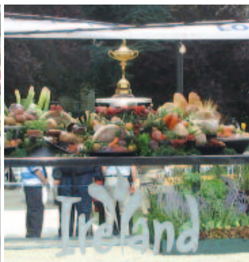
Närmare än så här kommer vi aldrig Ryder Cup-bucklan.