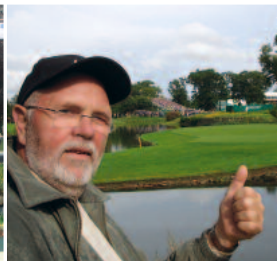
Kay gör tummen upp för K-Club och Ryder Cup!