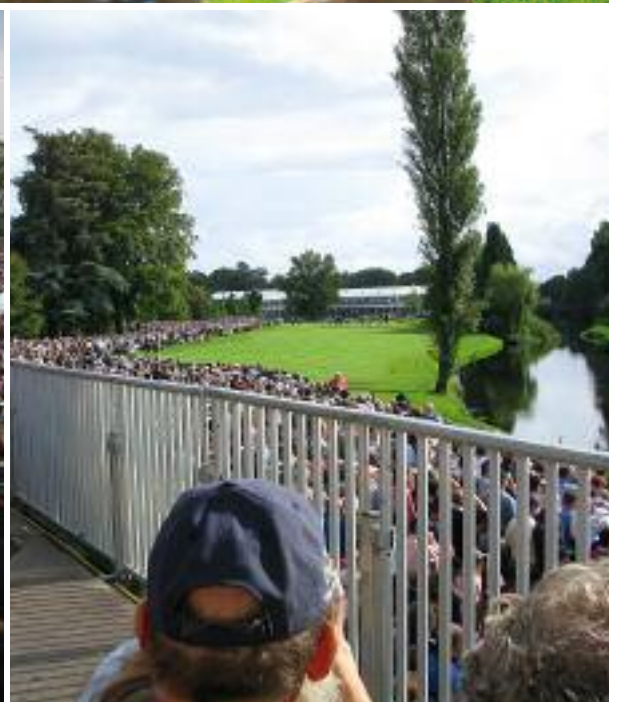
Överst: K-Clubs golfhotell. Mitten: 1, 2 och 3 (Tiger Woods, Chris Dimarco, Phil Mickelson och Jim Furik) på världsrankingen och ändå vann "vi"! Nedan: Invigningsseremonin hölls på klubbens driving range, liknade mer en popkonsert. Kolla publikleden på hål 16.