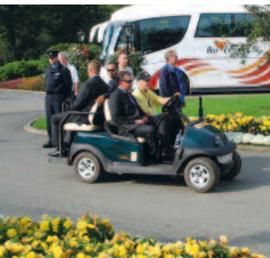
Säkerheten kring Tiger Woods är stor.

Redan på inspelningsdagen var det slutsålt, vilket innebar 45.000 åskådare. Nu var troli-