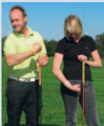
Vem är starkast - årets stora fråga!

Juniorerna har åter igen visat att det finns talanger i Tranås GK. Vi har fler och fler som spelar på de högre tourenerna. Många har sänkt sig och fler har visat att de kan vinna på tourer och på klubbträvlingar. Vinna är inte allt - huvudsaken är att vi har KUL, för då föds framgång.