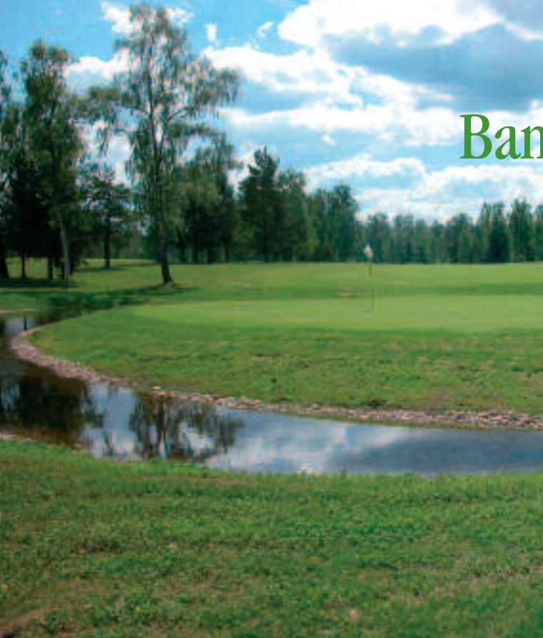
Det nya greenområdet på 12:an är klart