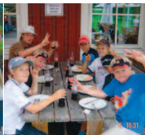
Hamburgare och läsk bjöds det på Sommarlovstourens avslutning. Det verkade uppskattas!