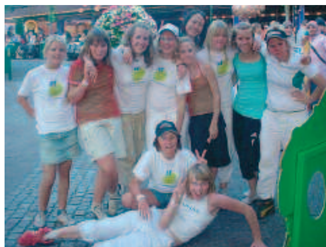
Glatt tjejgäng på Gröna Lund!