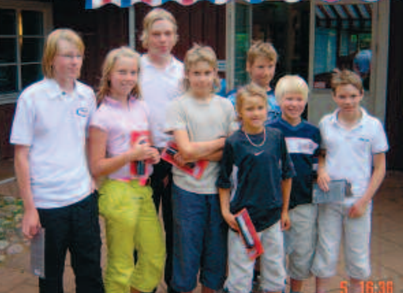
Vilken prisutdelning är detta? Bankboken?