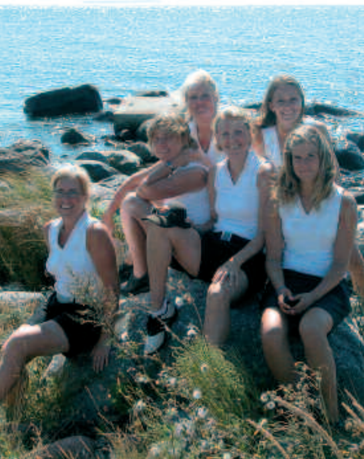
Visby GK ligger alldeles bredvid havet och efter avslutat spel badade vi i 25-gradigt vatten.