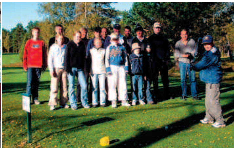
En del av gänget som var med på junioravslutningen.