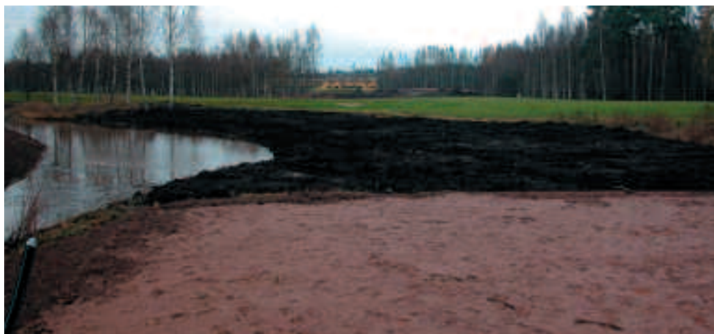
Bild tagen från damtee på det nya par 4-hålet.

Målsättningen är att åtgärderna inte skall påverka spelet i för stor omfattning.