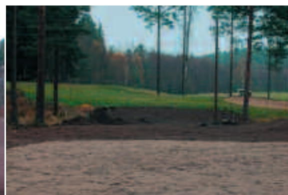
Greenområdet på den nya par 5:an och vy från tee på par 3-hålet.