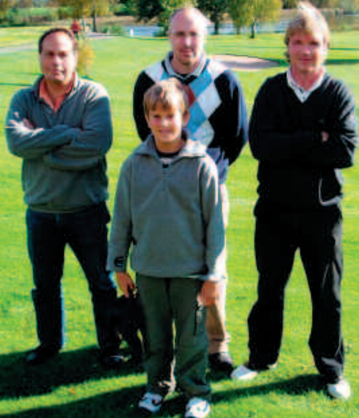
Det segrande laget på junioravslutningen. De hade förmodligen god hjälp av att Julle gjorde bole in one på 2:an!