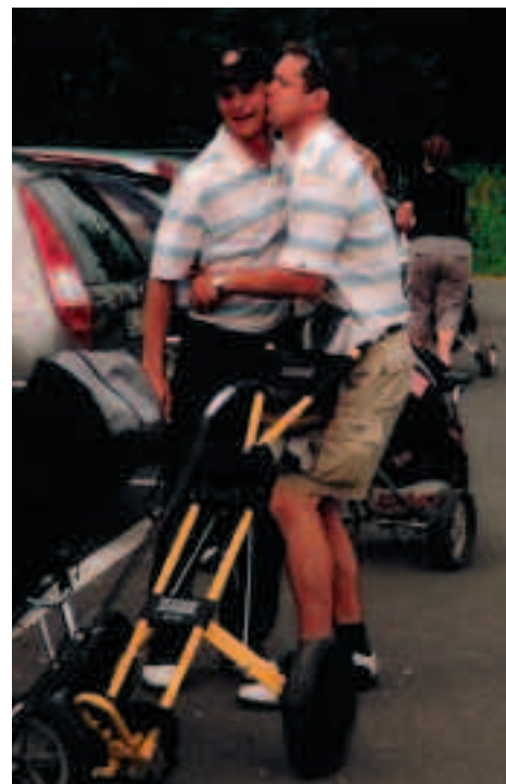
Det gick inte så bra för herrlaget men sammanhållningen och lagkänslan är god!