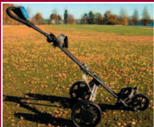
3-hjulsvagn som sparar ryggen. Lätt att fälla ihop och tar liten plats.