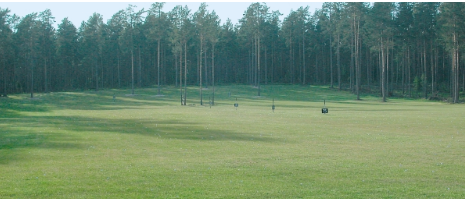
"Snyggaste driving rangen i Sverige", sagt av en greenfee-spelare