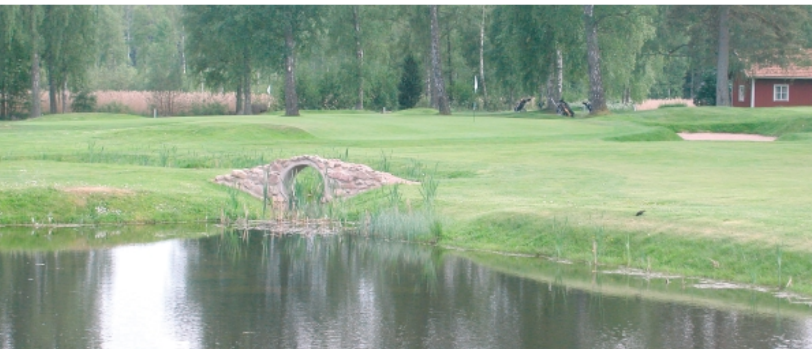
Lite "Augusta-feeling" över den nya bron på 11:an