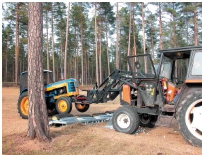
Mikael Lago kom till undsättning med sin traktor