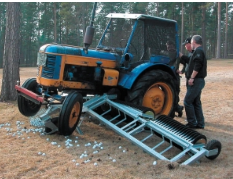
Premiärturen slutade inte riktigt som det var tänkt.