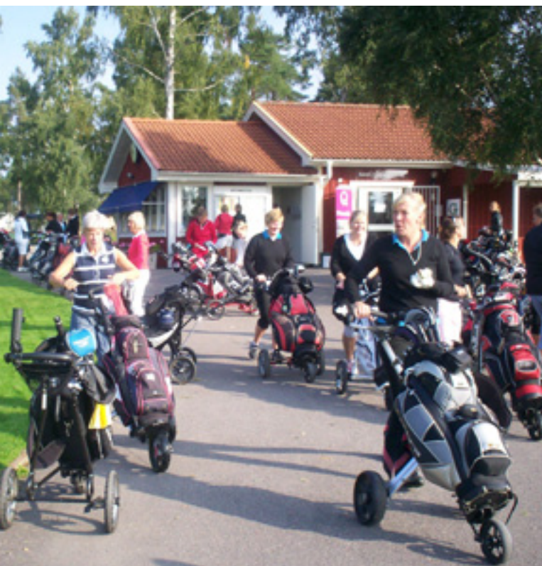
Högt deltagande hade vi i Qtee tävlingen. Missa inte den nästa år!