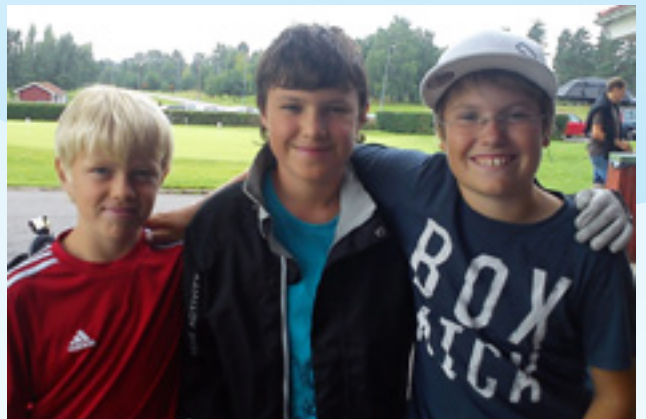
Tre glada killar som gillar golf!