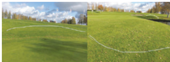
Förslag till ny klippning på hål 18.