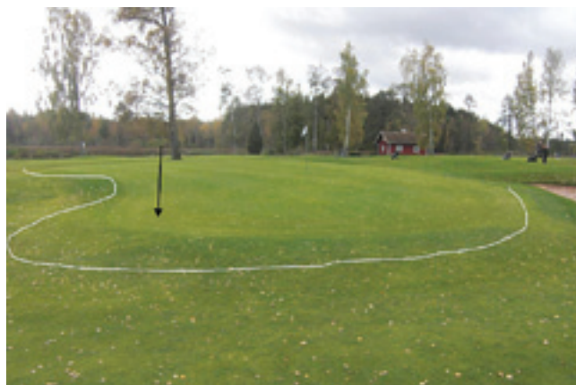
Ny layout på hål 11 green.

Rikta om tees så att vinklas bort från vägen. Förslag till ny klippning enligt bilderna till höger.