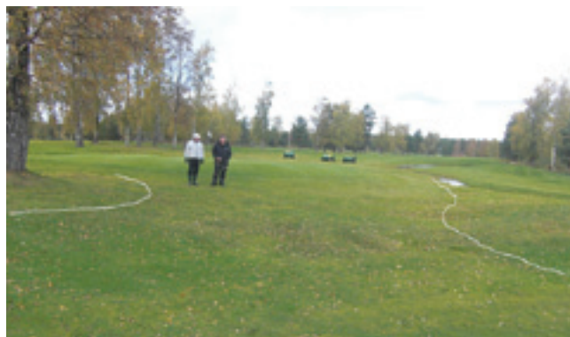
Förslag till häftig klippning mellan hål 11 och 15.