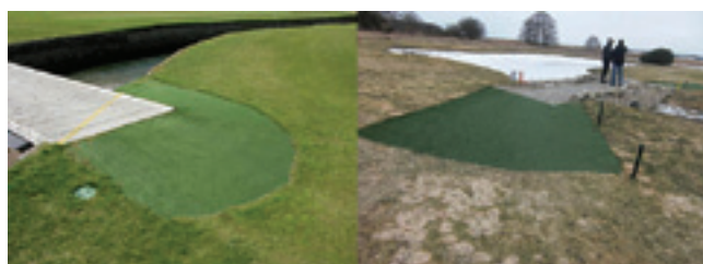
Exempel på hur man kan lägga konstgräs på områden som slits mycket.