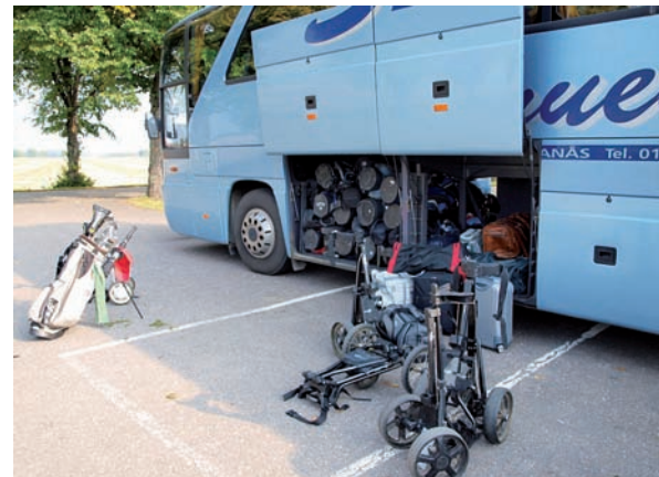
En fullpackad buss på väg till Vara Bjärtorp.