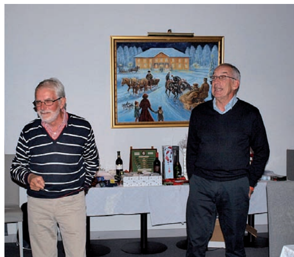
Storsångare framför kvällens prisbord.

GG's höstmöte 29 november 18.00 i klubbhuset. Val av ny styrelse i GG – kom och gör din stämma hörd.