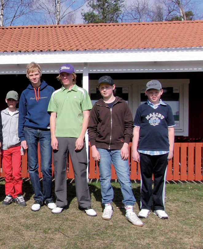
Träningsläger under påsklovet