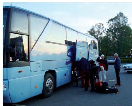
Lastning för färd till Söderköping.

GG's höstmöte 25 november 18.00 i klubbhuset. Val av ny styrelse i GG - kom och gör din stämma hörd.