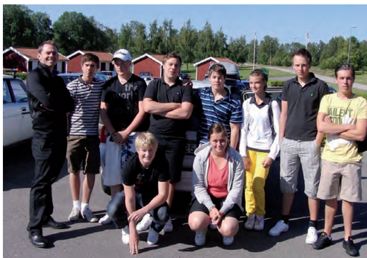
Laget som spelade JSM.