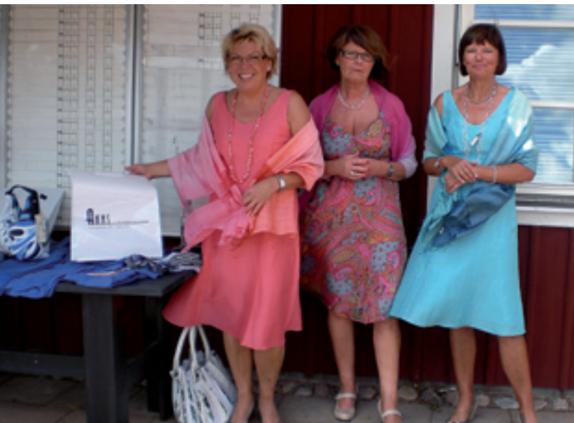
Snygga mannekänger från Ann's modevisning.

Nu är det åter dags att samla ihop golfäret och försöka sätta det på pränt med några rader.