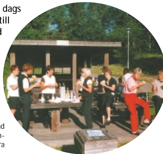
Bilder från utflykt i gröna. Inleddes med i frukost i Boxholm.