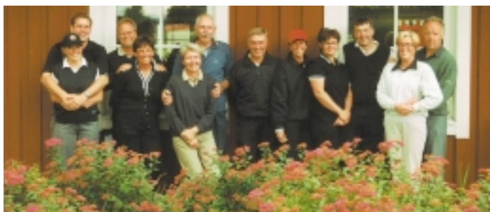
Stor uppslutning från hemmaklubben