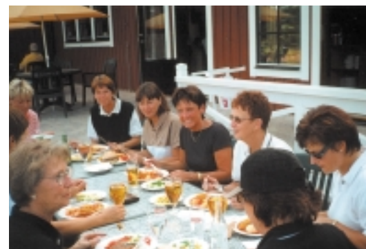
Mat! Smakade bra efter golfen.